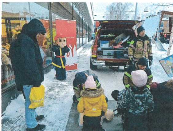
Flammy i samverkan med räddningstjänsten

Brandskyddsföreningen ställde upp med Flammy som informerade om brandskydd. Delade ut brandvarnare och testhorn. Ett uppskattat inslag både bland unga och äldre.