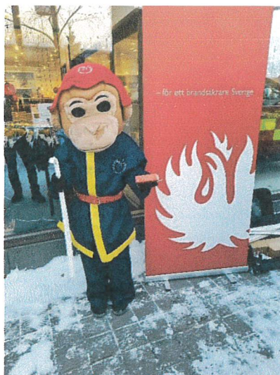
Flammy för ett brandsäkert Gävleborg