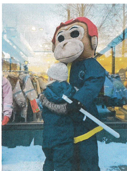
Flammy delar ut kramar till barn.

Någon brandskyddsvecka genomfördes inte V 37. Kommer att genomföras under två veckor 2024, V 11–12.