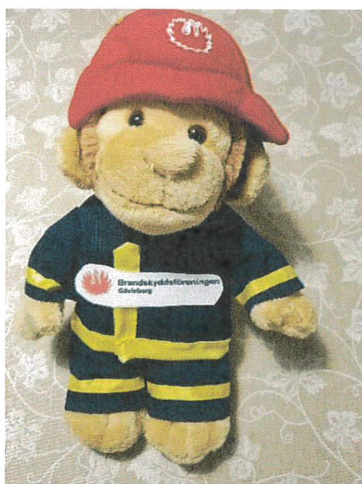
Flammy, Brandskyddsföreningens maskot

Under V 46–48 genomfördes kampanjen Brandsäkert boende. Budskapet ”Har du koll på de fyra B:na inom brandskydd” har spridits på olika sätt. Brandskyddsföreningen Gävle borg fick tid och möjlighet att informera i P4 Gävleborg. Lyckades dessutom att få in debattartiklar i ett antal läntidningar rörande äldres behov av ett anpassat brandskydd. Dessutom har ett samarbete pågått med socialförvaltningen i en av kommunerna i länet där en person gjort hembesök hos äldre 70+. Brandskyddsföreningen har bistått med råd och material i form av brandvarnare, brandfilter, rapportering m m. Ett lyckat samarbete som förhoppningsvis ska fortsätta även 2024. Även ett samarbete med länets räddningstjänster i form av Flammys julkalendrar har genomförts. Möter allmänheten på div julslytningar i länet.